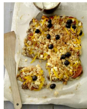
Griechischer Blech-Hackbraten aus dem Kapitel „Fixes vom Blech“

Presstext und Bilder (300dpi) zum Downloaden unter www.medien.bettybossi.ch