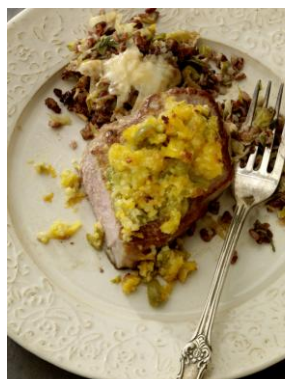
Kalbssteak mit Orangen-Oliven-Kruste aus dem Kapitel „Die Edlen“