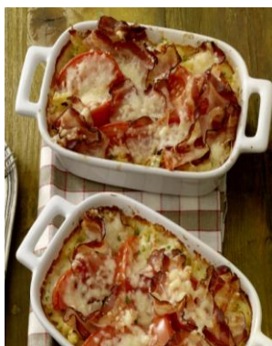
Spiralengratin mit Speck und Tomaten aus dem Kapitel „Die Schnellen“

Preis: CHF 19.90 (für Nicht-Abonnenten); Vorzugspreis für Abonnenten CHF 14.90. Zu bestellen unter www.bettybossi.ch