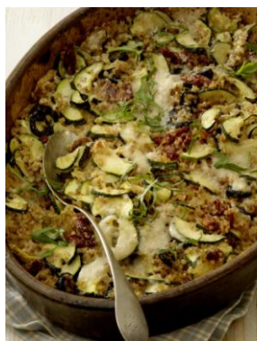
Mediterraner Bulgurgratin aus dem Kapitel „Die Leichten“