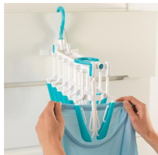
Praktisches Aufhängen von T-Shirts