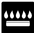
feux de gazinière