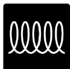
plaques à induction